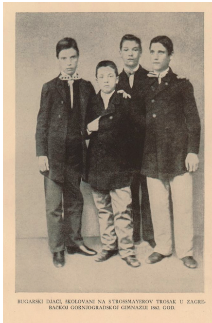
BUGARSKI DJACI, SKOLOVANI NA STROSSMAYEROV TROSAK U ZAGREBU, BACKOJ GORNJOGRADSKOJ GIMNAZIJII 1862. GOD.

hvaljujući financijskoj potpori biskupa Strossmayera, školovali bugarski đaci. Mnogi od njih su tada nastavili i svoje fakultetsko obrazovanje u Zagrebu, a po povratku u Bugarsku kao profesori, kulturni djelatnici, političari i znanstvenici snažno su doprinijeli jačanju bugarske države i njezin razvoj nakon oslobođenja od turskog ropstva 1878. godine. Nakon strašnog potresa u Zagrebu u ožujku 2020. g., Vlada Republike Bugarske odlučila je pomoći obnovu Gornjogradske gimnazije novčanom donacijom od 50.000 eura. Isplata je izvršena na račun gimnazije 31. prosinca 2020. godine.